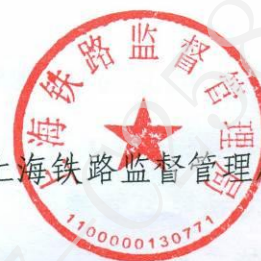
上海铁路监督管理局