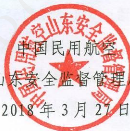
山东安全监督管理局