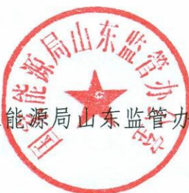
国家能源局山东监管办公室