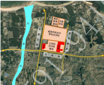
项目地理位置示意图