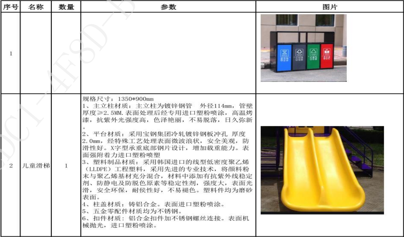
冶口棚改一期设施参数表